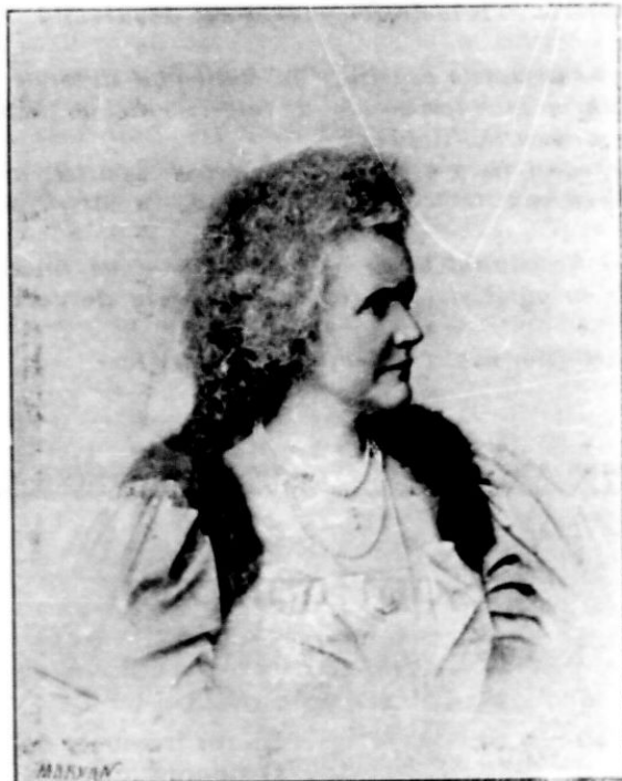
M. S. REGINA ELISABETA