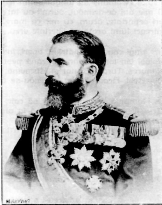
M. S. REGELE CAROL I